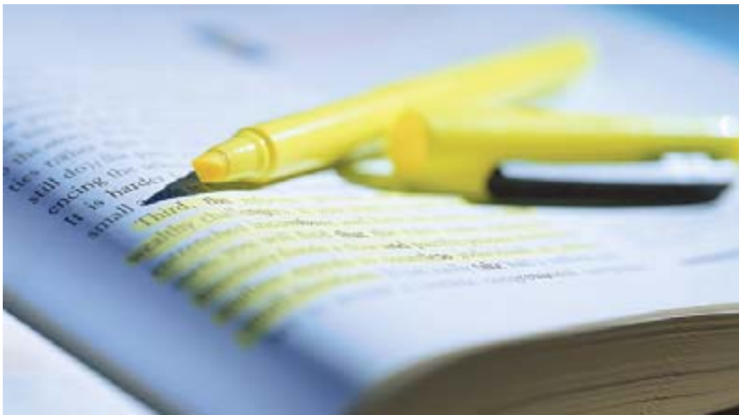
Alla Mostra del libro

IL TEATRO. Per legare sempre più stretto il filo che unisce scrittura e recitazione, da stasera alle 18, al Filigosa, reading musicali, incontri con attori, spettacoli, poesie in sardo e italiano, musica, e recite al Teatro Costantino. E domattina la presentazione di un cd della media Binna-Dalmasso e l'esibizione del coro.